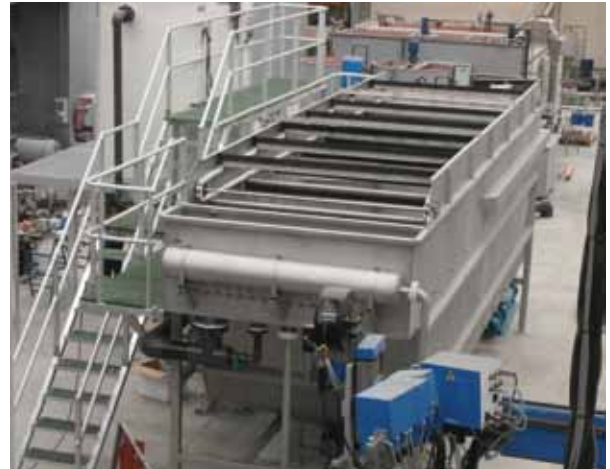
FIGURA 2. Detalle de ensayos de coagulación y floculación.