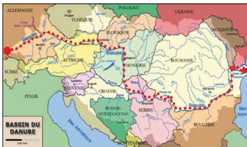
FIGURA 1. La movilidad transnacional de la contaminación emergente o el enemigo silencioso que no entiende de fronteras.

En las Tablas 3, 4, 5 y 6 se resumen, a partir de datos bibliográficos y diversos estudios sobre varias de