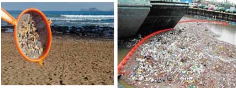
FIGURA 2. Plásticos y microplásticos.

til-fenoles, f-talatos, Bisfenol-A, PCB, PBB, dioxinas, furanos TBT, 3,4-dicloranilina, 4-nitrotolueno y resorcinol. No obstante, en la actualidad se está en proceso de definición clara del disruptor endocrino para pasar a elaborar una normativa particular al respecto, con inclusión de sustancias y niveles paramétricos exigibles. En este sentido, uno de los principales problemas al efecto es la falta de estudios toxicológicos de campo suficientemente contrastados.